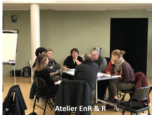
Atelier EnR & R

Il n'y a pas eu de CR de ces ateliers, mais les cartes mentales annotées et complétées, qui ont été retranscrites dans le projet de plan d'actions, soumis ensuite à la validation des COTEC et COPIL.